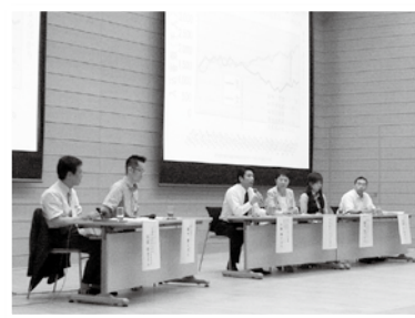
エコホテルフォーラム パネルディスカッション (2008年7月)

内容 宿泊施設利用者側へのアンケートを実施し、結果を何らかの形で紹介する。2007年度に実施をした宿泊業者を対象とした環境の取組調査内容の見直しを行う。